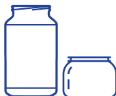
тегле без поклопаца

Стаклени отпад који не треба одвајати у жути контејнер: